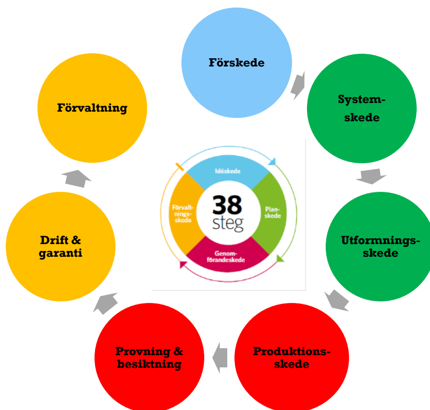
Figur 2. Energikartans skeden med överlämnanden (grå pilar).

I figur 2 visas Energikartans fyra huvudskeden på liknande tillvägagångssätt som "Ett-hus-blir-till", där färgskalan försökts återanvändas. Skillnaden från "Ett-hus-blir-till"-skedena är att system- och detaljprojekteringen ansågs så viktig att de åsattes ett eget skede (gröna cirklar). Det är också lämpligt att dela upp genomförandeskedet i olika projekteringssteg samt produktionssteg. Dock kan ordningen som dessa steg utförs i variera något beroende på entreprenadform. De grå pilarna mellan skedena representerar viktiga upphandlingar och överlämnanden mellan skedena och delskedena. Dessa sker i praktiken på lite olika ställen beroende på entreprenadform.